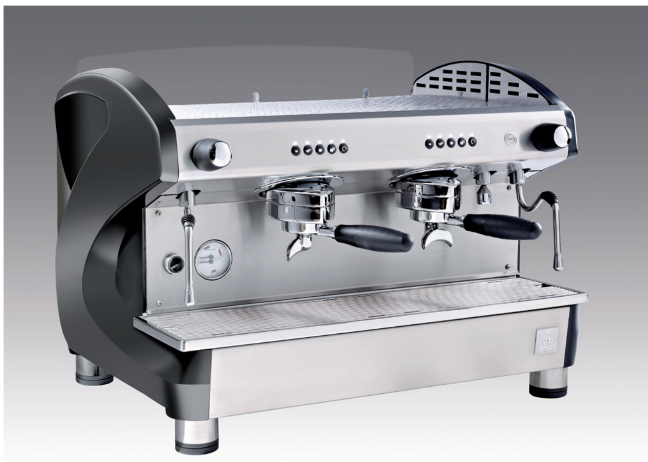
Coloris: Gris Anthracite / Noir (Piano black) / Blanc (Piano white) – Disponible en 1, 2 et 3 groupes

Qualité de fabrication, robustesse de fonction et limitation des coûts d'usage: la gamme VIVA offre une synthèse élégante au service de la performance.